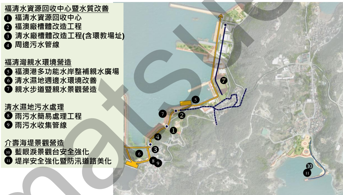
圖 1 「樂活藍灣—南竿水環境改善計畫」規劃構想圖

南竿鄉是連江縣面積最大、人口最多的行政區，亦是四鄉五島發展核心。做為水環境建設之首要地區，依照不同發展屬性可劃分為經濟海岸線、文化海岸線及門戶海岸線(圖 1-3)。經濟海岸線橫跨南竿鄉福澳村及清水村海岸沿線，即稱福清灣，兩村之污水處理效能將影響福清灣週邊海域水質。清水村目前污水量已遠超出既有清水污水處理廠處理負荷，而福澳村近年規劃多項景觀營造及觀光提升計畫，且陸續新增港務大樓、旅客中心及相關行政大樓設施，預期遊客量將逐年增加，福沃污水處理廠既有處理能力恐有不足。據此，樂活藍灣計畫針對水質改善、生態維護及環境教育予以整體規劃，樂活藍灣計畫分區規劃構想如圖 1 所示。