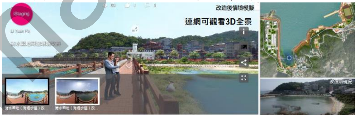
圖 2 「清水濕地雨污水處理」願景圖

建立符合全國唯一島嶼澳口型之濕地經營模式，使濕地生態功能及民生利用效益得以相輔相成，成為環境教育地操作場域。在濕地生態保育的原則上建立及合理的遊憩方式。規劃願景如圖 2 所示。