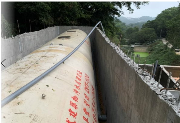
合併式淨化槽施作