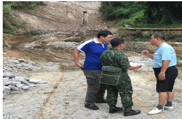
淨化槽與放流水設施協調