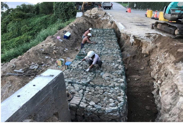
邊坡保護措施施作