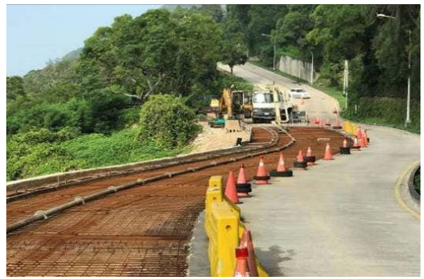
周邊道路及人行道修整