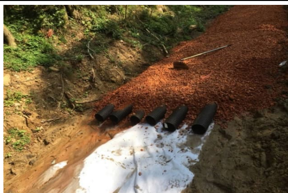
瀘水層下方透水管